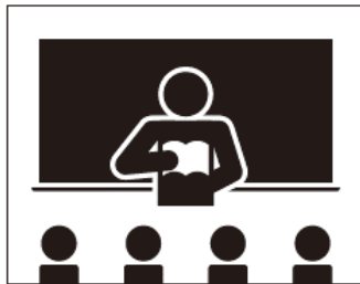
【 A 】